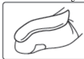
O unitate de vârf de deget