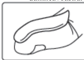
O unitate de vârf de deget